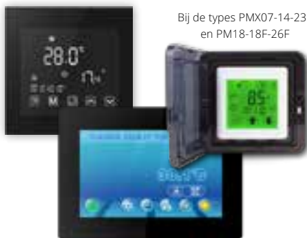
Bij de types PMX07-14-23F en PM18-18F-26F