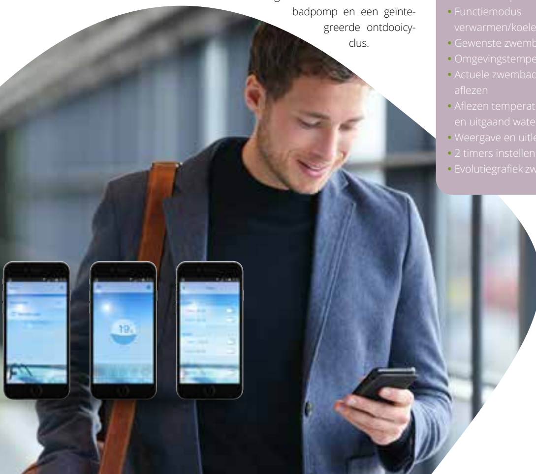
Bij de types PM22i-30iF en PMX14i-18i-18iF